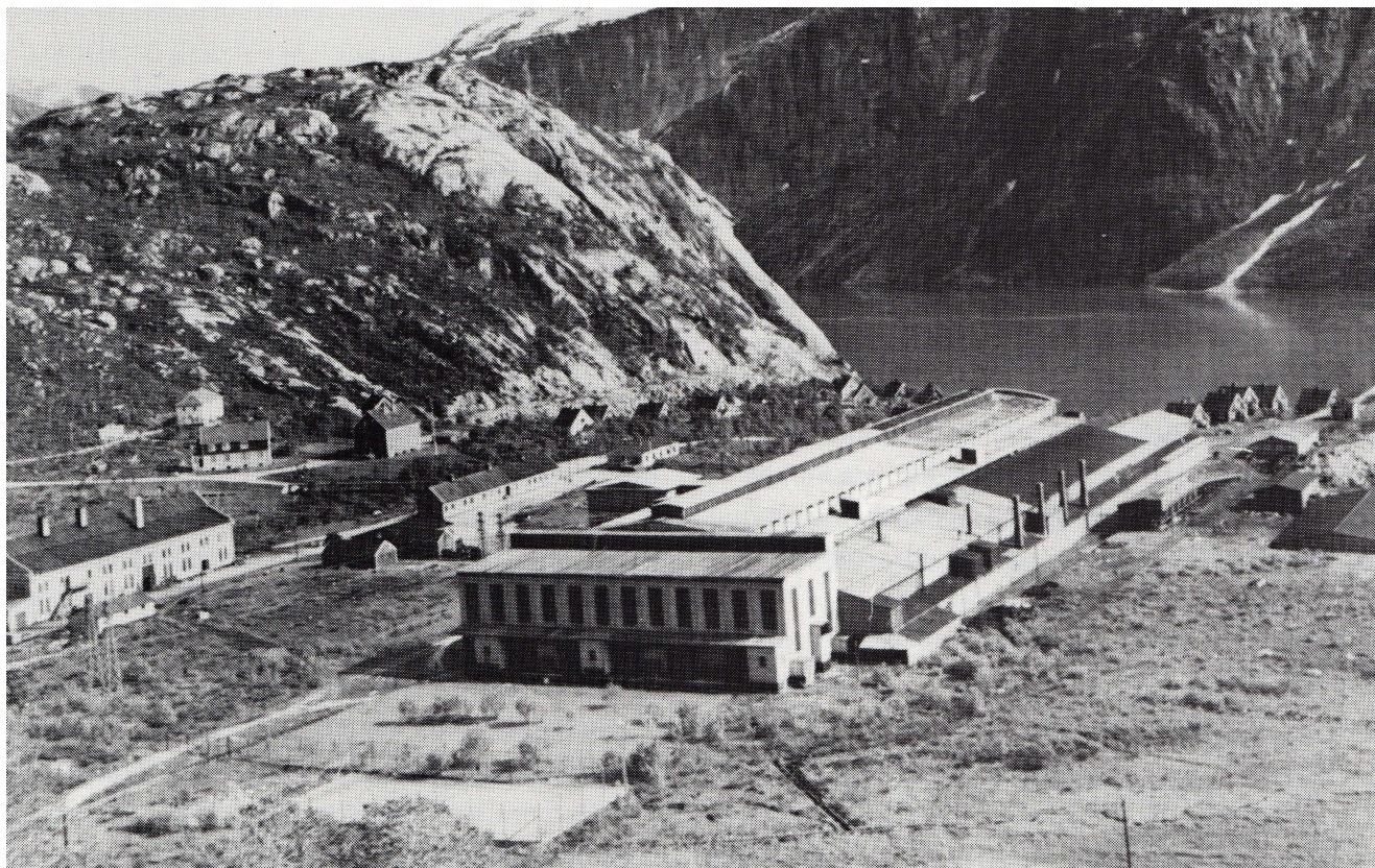
Da vi kom til Glomfjord, holdt de på å bygge mye av det bildet her fra Haugvik viser.

1.mai-toget var flott, med hornmusikk, faner, flagg og mye folk. Når toget kom til et hus der det bodde streikebrytere med familier, sluttet musikken å spille, farten på toget ble redusert og flagg og faner ble senket mens toget passerte. Om kvelden kom noen av streikebryterne til festen på Dampkjøkkenet, men de ble jaget bort etter veien mot Haugvik. Flere ble nådd igjen og fikk kraftig juling. Dette var det verste vi gutter opplevde, voksne menn som sloss brutalt. Opplevelser som ikke går an å glemme.